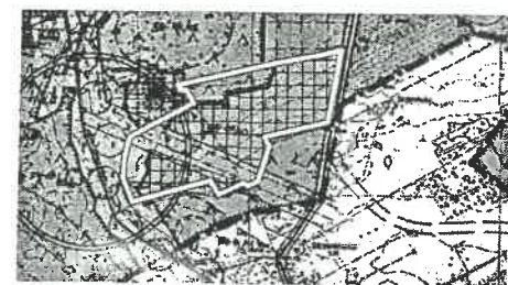
Wyrzys ze studium uwarunkowań i kierunków zagospodarowania przestrzennego gminy Brwinów - miejscowość Kanie - teren w Popówku