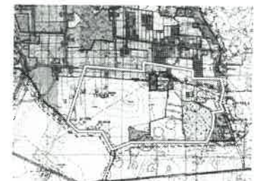
Wyrys ze studium uwarunkowań i kierunków zagospodarowania przestrzennego gminy Brwinów