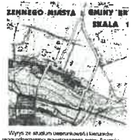
Wzrost ze statum urbanizacji i kierunki zagospodarowania przestrzennego gminy Brwinów

Załącznik nr 1 do uchwały Rady Miejskiej w Brwinowie z dnia nr